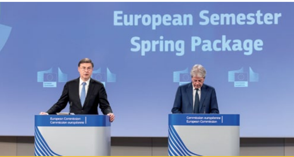
Valdis Dombrovskis (links) und Paolo Gentiloni auf der Pressekonferenz zum Frühjahrspaket 2023 des Europäischen Semesters.

Die EU-Kommission hat die Mitgliedstaaten ermuntert, die Energiehilfen für Unternehmen und Haushalte bis zum Ende des Jahres abzubauen. Valdis Dombrovskis, Exekutiv-Vizepräsident der EU-Kommission, stellte klar , die Mitgliedstaaten sollten die eingesparten Mittel zum Abbau ihrer Haushalts-Defizite einsetzen.