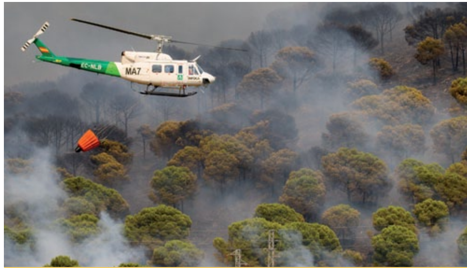
Löscharbeiten in den Bergen von Mijas, Málaga

Allein in Sachsen wurden 2022 durch Brände rund 900 Hektar Wald