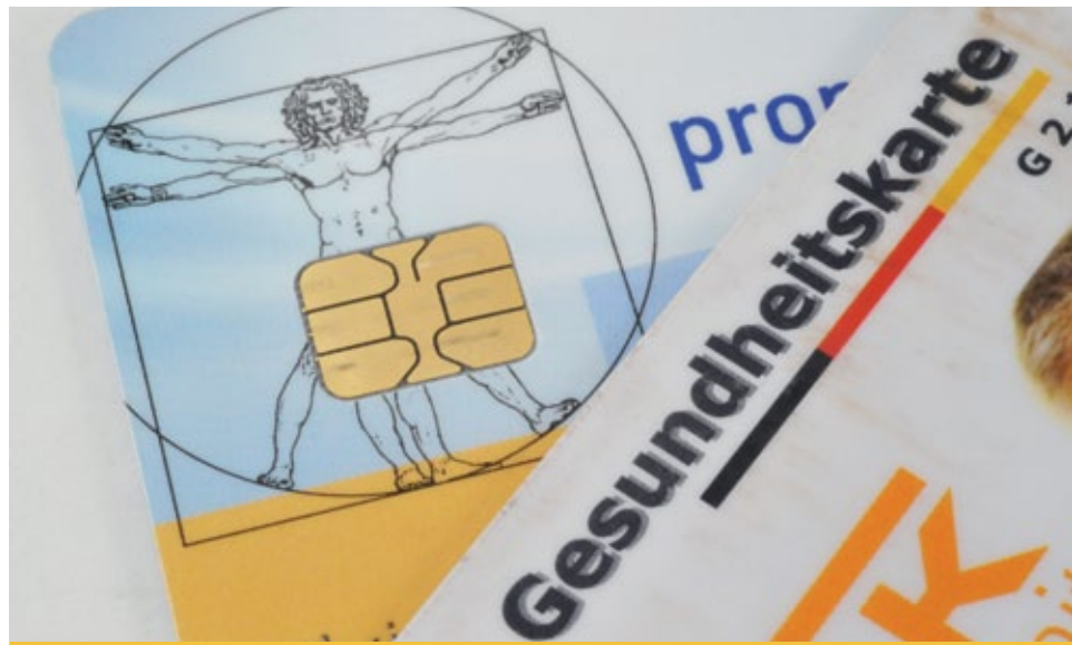
Bis Jahresende soll die digitale Krankenversicherungskarte kommen.

▶ Kosten senken: Valdis Dombrovskis, Exekutiv-Vizepräsident der EU-Kommission, betonte, die neue Initiative nütze Menschen und Unternehmen in ganz Europa. Sie erleichtert den Transfer