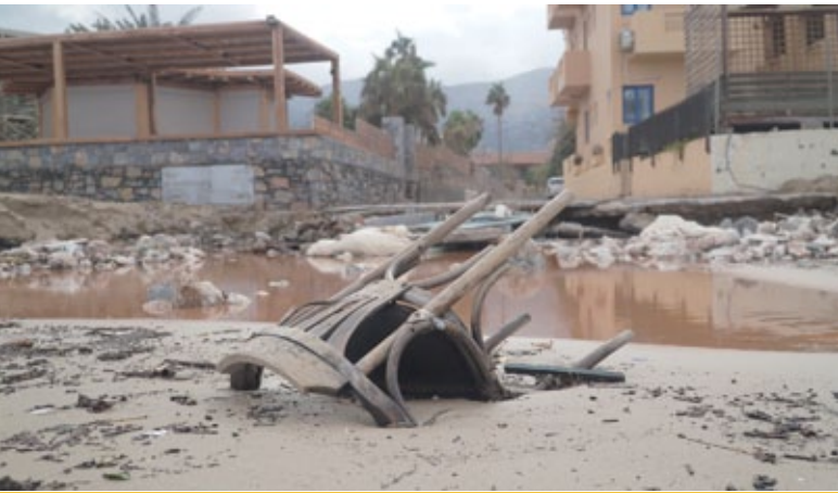
Überschwemmter Strand auf der Insel Kreta.

EU-Kommission und Mitgliedstaaten haben Griechenland im Kampf gegen die heftigen Waldbrände und Überflutungen in den Sommermonaten unterstützt. EU-Kommissionspräsidentin Ursula von der Leyen sagte nach einem Treffen mit dem griechischen Regierungschef Kyriakos Mitsotakis: „Meine wichtigste Botschaft ist, dass die Kommission Ideen entwickeln und schnell und flexibel sein wird: Wir werden alle EU-Mittel mobilisieren, die eingesetzt werden können.“